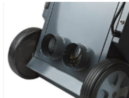
Modely CDT 30 S a CDT 40 S jsou vybaveny topným článkem o výkonu 1 kW, vysokotlakým ventilátorem a dvěma přírubami na potrubí, které umožňují připojení dvou flexibilních vzduchovodů Ø100, každý o délce až 5 m.

Mobilní odvlhčovač CDT lze dodat s kazetou pro čerpadlo kondenzátu namontovanou namísto nádoby na vodu. To čerpá kondenzovanou vodu do odtoku. Při použití tohoto čerpadla kondenzátu nebude váš odvlhčovač vyžadovat údržbu, protože nebudete muset vyprazdňovat těžkou nádrž zaplněnou vodou. Výška hladiny je max. 4 m. Kazeta pro čerpadlo kondenzátu je k dispozici jako příslušenství.