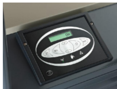
Digitální displej s integrovanou regulací vlhkosti, čítačem energie, stavem provozu a snadným zjištěním poruchy umožňuje optimální odvlhčování.