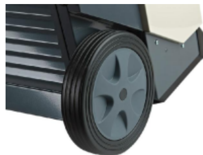
Velká gumová kola zajišťují bezpečné a snadné manévrování.

Všechny odvlhčovače řady Dantherm CDT jsou kondenzační odvlhčovače. Zabudovaný ventilátor nasává vlhký vzduch do odvlhčovače a vhání jej do odpařovače. Jakmile se teplý vlhký vzduch setká se studeným povrchem odpařovače, zkondenzuje na vodu, která je vedena do nádoby na vodu. Během procesu se suchý vzduch zahřeje a vrací se do místnosti. Opakovaná cirkulace vzduchu skrze jednotku snižuje relativní vlhkost, čímž dochází k velmi rychlému, ale jemnému vysoušení.