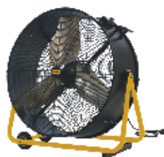
DF 30 P