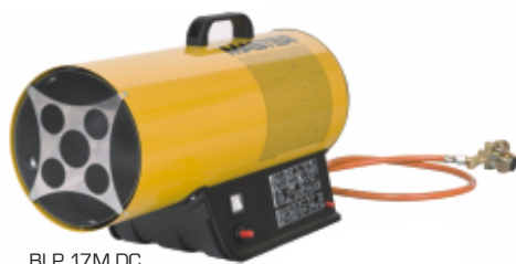
BLP 17M DC

Tato plynová topidla s ručním piezo zapalováním umožňují provoz topidla zcela nezávisle na napájecí elektrické síti po dobu delší než 8 hodin. Lithiovou 3 Ah / 14,4 V baterií lze od topidla snadno odpojit a dobít. Provoz je možný i standardní cestou pomocí elektrického síťového adaptéru. Baterie je kompatibilní s akku BOSCH 14,4V příslušné řady.