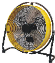
DF 20 P